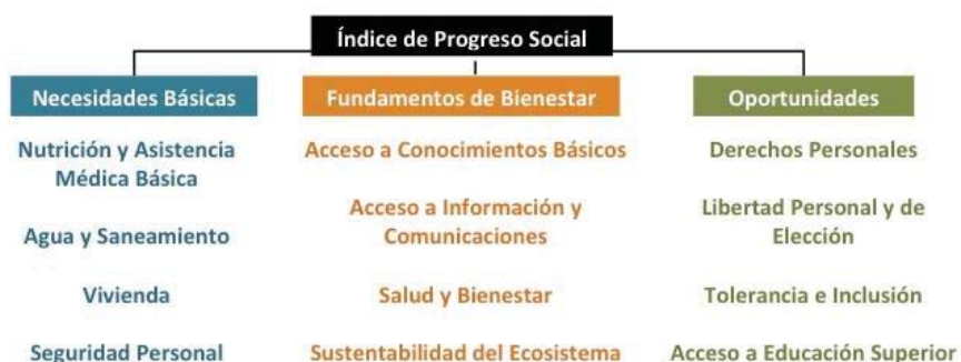
Figura 1. Anexo 3. Modelo del Índice de Progreso Social.

La metodología del Índice de Progreso Social permite la medición de cada componente y de cada dimensión, a la vez que ofrece, un puntaje general y una calificación del desempeño de una sociedad en un determinado aspecto del bienestar; además de la posibilidad de identificar los temas prioritarios que requieren de intervenciones sociales.