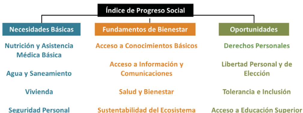
Fig. 1 Estructura general del Índice de Progreso Social

Cada una de estas dimensiones contiene cuatro componentes, y cada componente está compuesto de tres a seis indicadores.