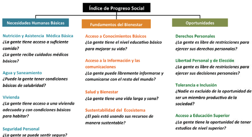
Figura 2. Anexo3. Conceptos a medir en el modelo del IPS.

La metodología del Índice de Progreso Social permite la medición de cada componente y de cada dimensión, a la vez que ofrece, un puntaje general y una calificación del desempeño de una sociedad en un determinado aspecto del bienestar; además de la posibilidad de identificar los temas prioritarios que requieren de intervenciones sociales.