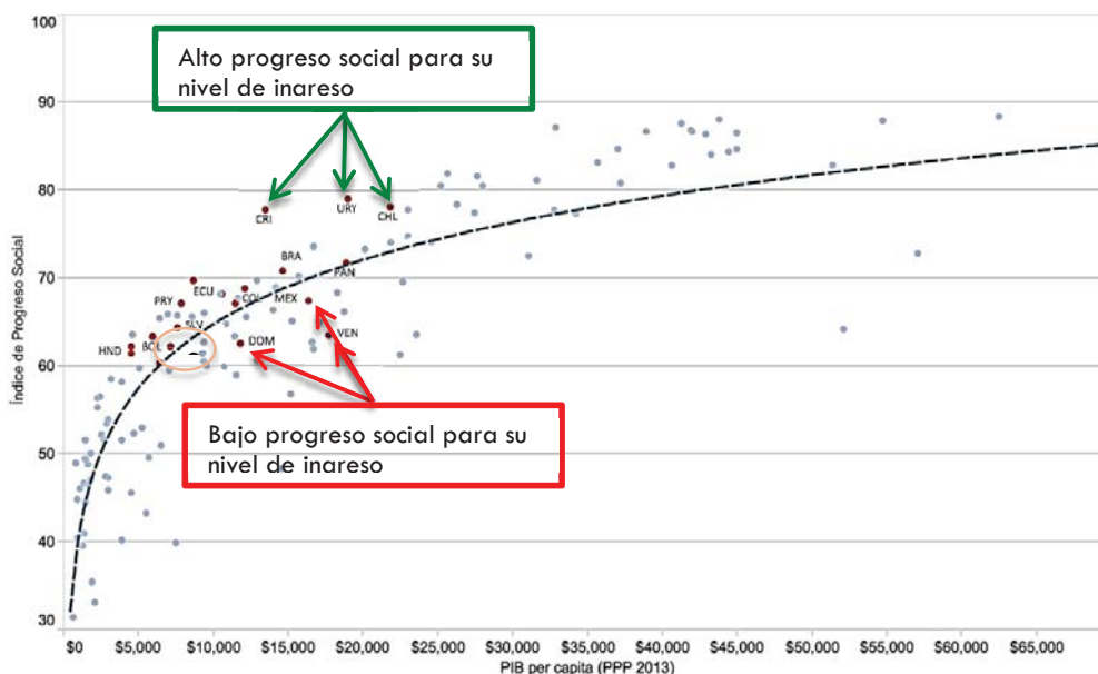
Gráfica 1. PIB per cápita vs. Progreso Social. año 2014